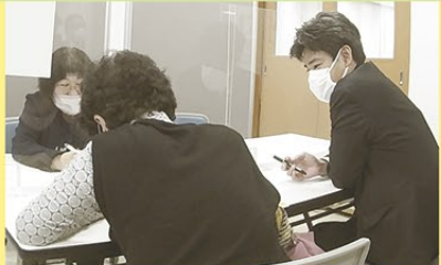
無料相談会の様子