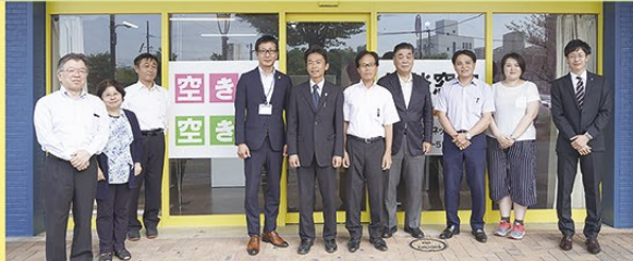
経験豊富な空き家コーディネーターが対応いたします