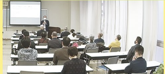
無料セミナー開催