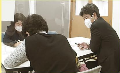
無料相談会の様子