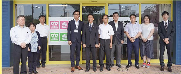
経験豊富な空き家コーディネーターが対応いたします