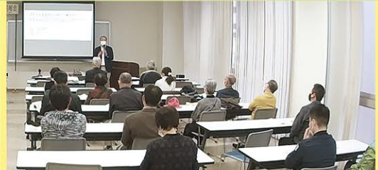
無料セミナー開催