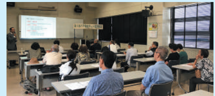
大牟田市と空き家・空き地に関する相談業務の協定を結び様々な困りごとの相談を受けています。国交省のモデル事業にも採択され、全国的にも先進的な取り組みを行っています。

利用者の声 私の実家は、父が亡くなったあと母が一人で守っておりましたが、母も高齢となり老人ホームに入りました。 空き家 となっておよそ10年、家も荒れ、ずっと悩んでおりました。連絡するとすぐに対応していただき、買い手の方を仲介していただきました。長年頭を痛めていたことが解決し、母と共にほっとしております。本当にありがとうございました。(大牟田市、60代女性)